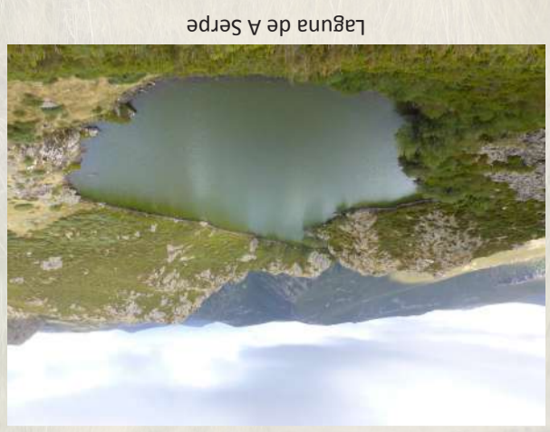
Laguna de A Serpe

La fauna que predomina en el Macizo de Trevinca es muy variada. Destacan el corzo ( Capreolus capreolus ), el lobo ( Canis lupus ), el jabalí ( Sus scrofa ), el águila real ( Aquila chrysaetos ), el vuitre leonado ( Gyps fulvus ), la estroza o rana de San Antonio ( Hyla arborea ), o la víbora de Seoane ( Vipera seoane ).