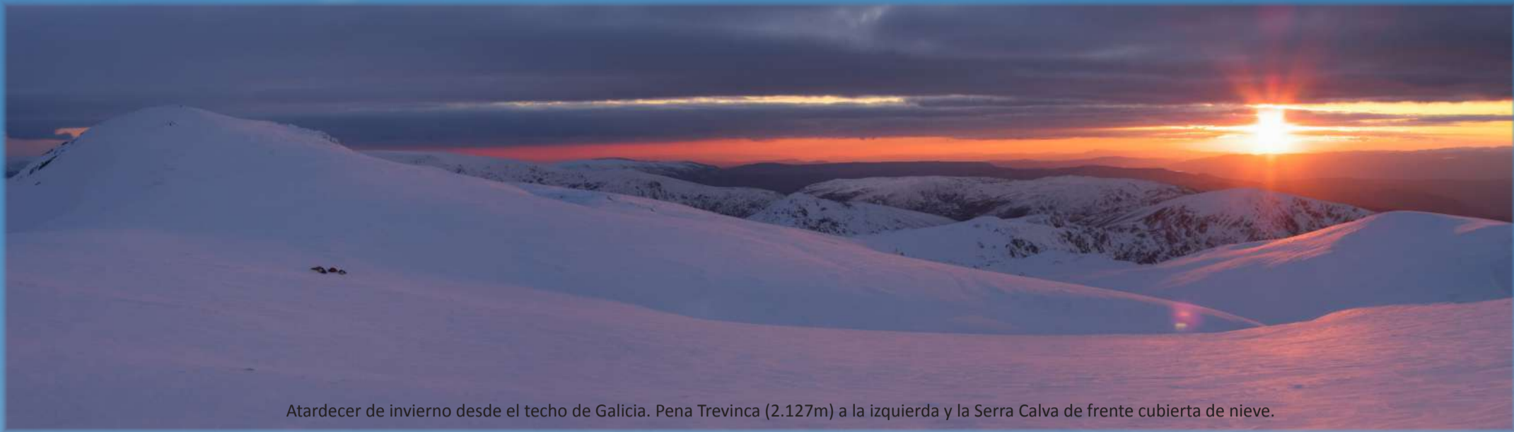
Atardecer de invierno desde el techo de Galicia. Pena Trevinca (2.127m) a la izquierda y la Serra Calva de frente cubierta de nieve.