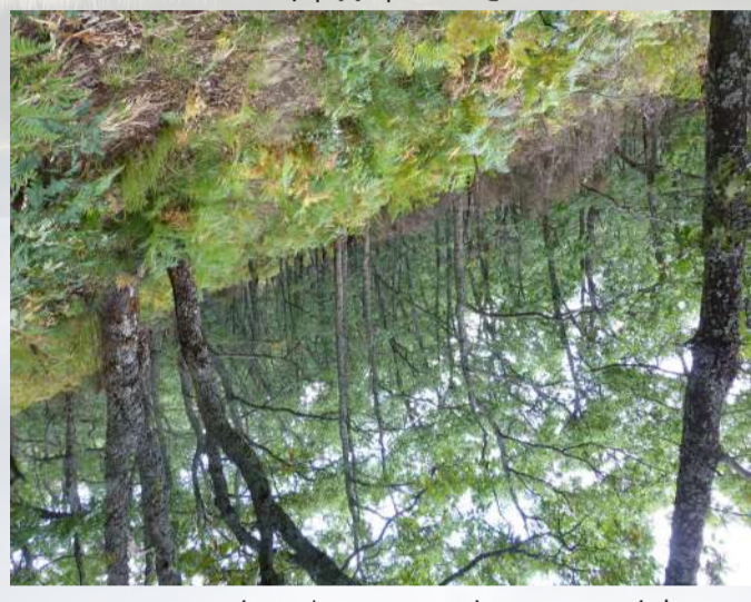
( Salix s.p. ) o el serbal ( Sorbus aucuparia ).

La mayor parte del macizo está dominado por el mato, sobre todo en las faldas y en las partes altas. En el mato tiene especial predominancia la retama y el brezo o, en menor medida y solo en las máximas alturas, el enebro ( Juniperus communis ssp. alpina ). En el fondo de los valles, el abandono de las antiguas tierras de cultivo facilita el crecimiento de un bosque protagonizado a grandes rasgos por el melojo ( Quercus pyrenáica ), el abedul ( Betula celtiberica ), el sauce ( Salix s.p. ) o el serbal ( Sorbus aucuparia ).