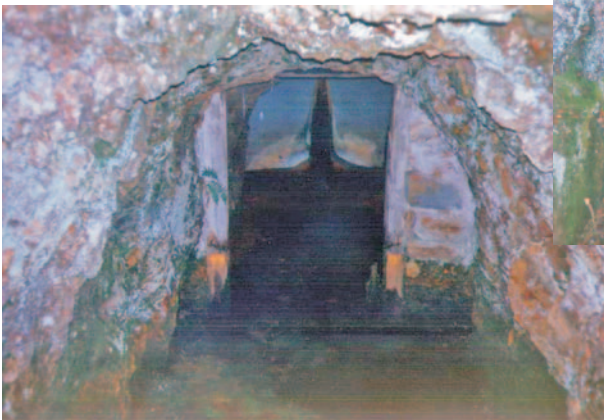
Boca de entrada da mina "Pepe"