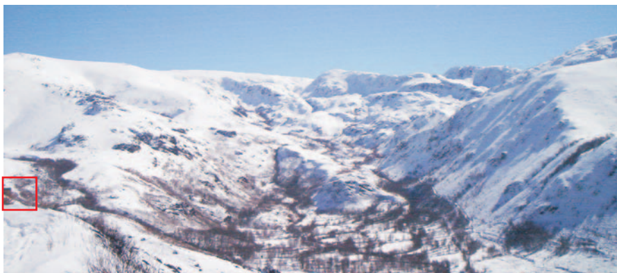
Situación da casa do propietario e oficinas (A dereita, val do río Xares)

No ano 1.937 volven traballar as minas de Vilanova na fase chamada “dos alemáns”. Os propietarios seguen sendo a familia Conde, pero son os alemáns quen xestionan e administran a explotación mineira. Esta segunda fase dura hasta o ano 1.944. Despois do abandono das minas polos alemáns, estas permanecen cerradas ata o ano 1.950, data na que os irmáns Conde as volven poñer en funcionamento. A fase final a penas dura un par de anos. A mediados ou finais do ano 1.952 as minas de Vilanova deixaron para sempre de producir wólfram, mineral que repartiu benestar económico entre os veciños de Vilanova, ademais como consecuencia do po con arsénico dentro das galerías, tamén repartiu en abundancia enfermidade, desgracia e morte.